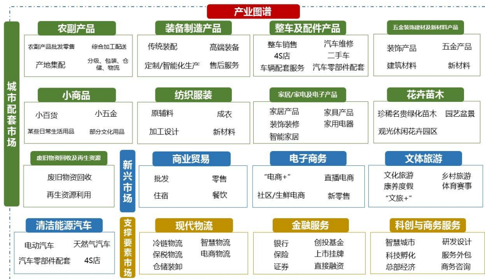
图 2：达州市现代专业市场群产业图谱

九类城市配套市场，即农副产品、装备制造产品、整车及配件产品、五金装饰建材及新材料产品、小商品、纺织服装、家居/家电及电子产品、花卉苗木、废旧物资回收及再生资源。